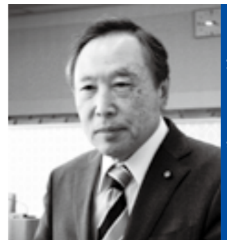
米山 昇 議員

市長 地元自治会や保護者などの意見を聞き、地域コミュニティへの影響がでないよう対応する考えである。