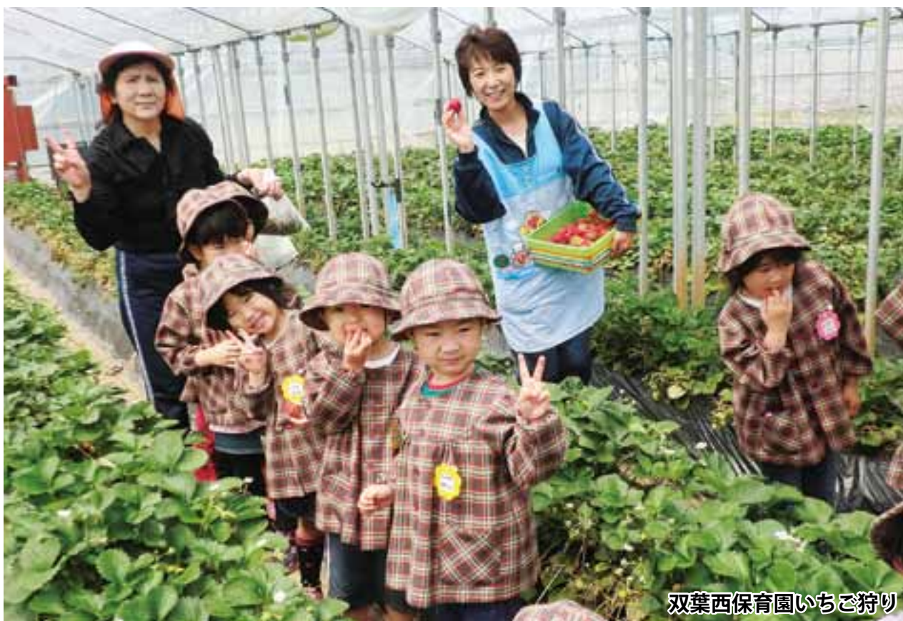
双葉西保育園いちご狩り