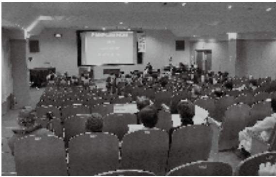
平成23年3月に開催された公聴会の様子(竜王図書館視聴覚室)

市長 本事業は、平成23年3月に甲府市および甲斐市の両市において、都市計画の手續きに基づく公聴会が開催され、9月に都市計画案および環境影響評価準備書の縦覧が行われた。さらに10月には、この環境影響評価準備書の説明会が開催された。今後は、環境影響評価書の手續きが完了後、都市計画決定の手續きが行われるので、地域のみなさんの理解を得た中で、国や県との調整を図り早期に事業化されるよう要請したいと考えている。