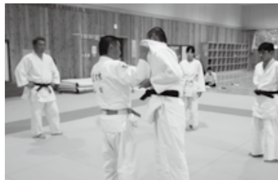
市内中学校の保健体育教諭による柔道指導講習会の様子

教育部長 本市には、柔道など専門分野に優れた外部講師が所属している団体があり、すでに派遣の申し出がある。