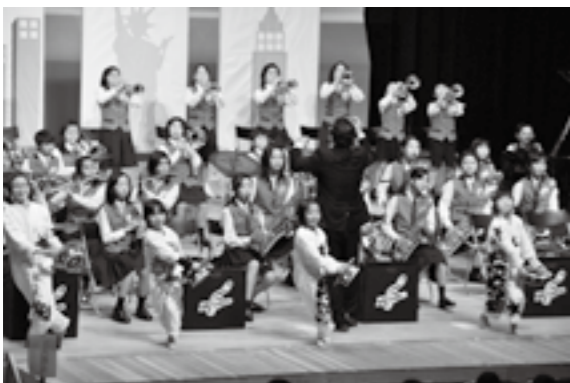
国文祭応援事業として1/28に開催された「甲斐市小学生バンドフェスティバル」の様子(数島南小学校吹奏楽部)

教育長 国では、平成13年に「文化芸術振興基本法」を制定し、国と地方公共団体の責務などを定めた。特に地域における文化・芸術の振興、国際交流の推進、国語の理解などの方針を積極的な取り組みとして提唱している。このため、本市では、「ふれあい文化館」などの施設の計画的な整備改修などをはじめ、創甲斐教育推進大綱の中では、自己表現力と国語力の向上を掲げるなど、市内の文化・芸術活動の充実を図っている。質問の条例制定は、県の動向を注視し先進自治体の状況を調査研究する考えである。