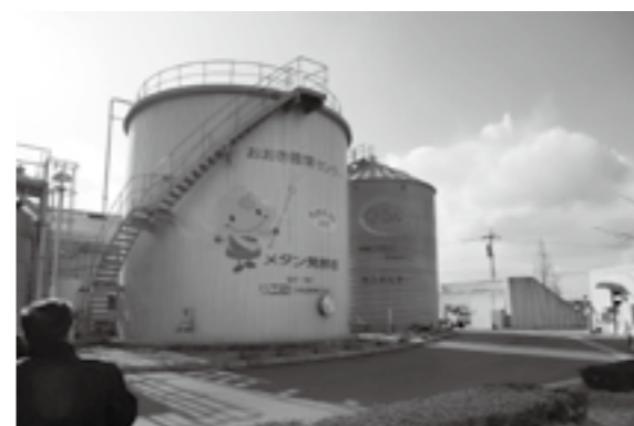
福岡県大木町おおき循環センター「くるるん」のメタン発酵槽

また、生ごみの減量化、剪定枝・間伐材などの地域資源の有効利用のため、現在、本市で粉碎した剪定枝チップをサンブルとして研修先へ送付し、油化実験を進めている。今後は、この実験結果を踏まえ施策の参考とする考えである。