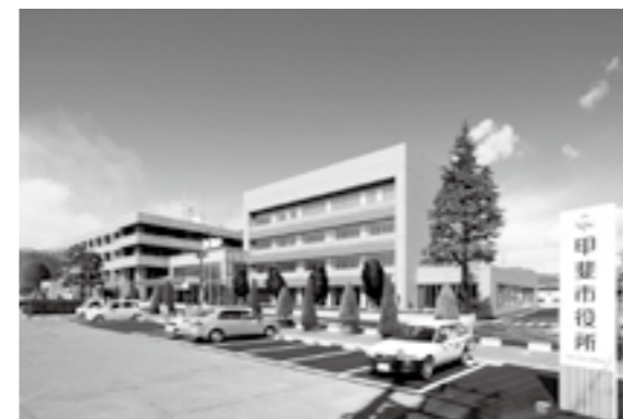
新市の重点プロジェクトにより整備された市役所新館

今後は、保育園の耐震化に併せた適正配置、防災計画の見直しをはじめとする市民の命を守る取り組み、さらに環境基本計画に基づく諸施策の実施に向け取り組む。