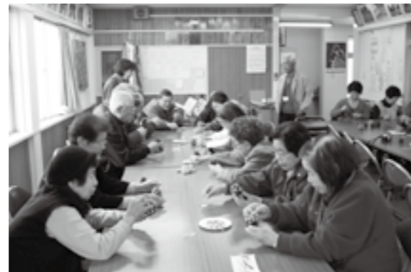
「下八幡2区いきいきサロン」活動の様子

市長 県内の自治体でも結婚相談員などによる取り組みはあるが、プライバシーの問題などで登録者の確保が難しいなど大きな成果につながっていない。今後、相談所などの設置は、先進地の取り組み事例などを研究したいと考えている。