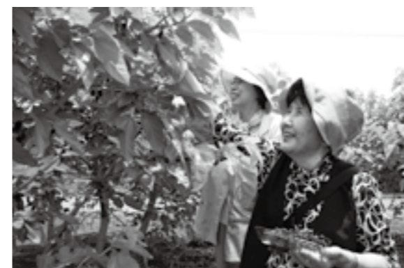
今年も6/9~17に実施される甲斐市商工会「桑の実摘み」

市長 今後の整備は、敷島総合公園西側の交差点改良工事や亀沢大橋の道路工事などを行い、平成26年度末に事業完了する計画である。