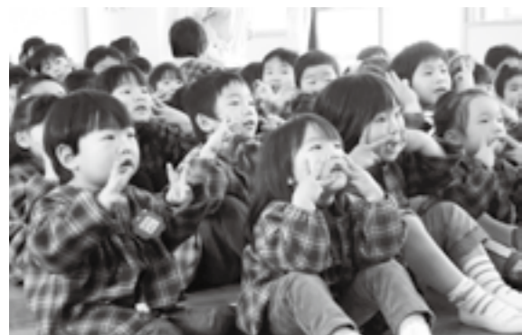
双葉西保育園「4月のお誕生日会」の様子

市長 閉園の時期は、平成27年度以降としているが、今後、保護者や関係者のみなさんの意見や国の「総合子ども園」の動向などを踏まえ検討する考えである。