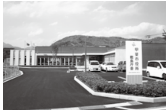
地中熱ヒートポンプを備えた市役所敷島庁舎

池神 市では、再生可能エネルギーに対する取り組みとして、太陽光発電システムへの奨励金導入を進めている。あの東日本大震災、東京電力福島第一原子力発電所の事故から1年が経っており、放射能の被害も拡大しているが、原子力発電およびエネルギー施策に対する市長の見解は。