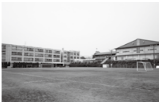
改修工事が計画されている双葉中学校

Q. 新年度の「敬老祝い金」は A. 継続するが見直しも検討 質問 昨年11月の模擬事業仕分けで「敬老祝い金」は見直しを要するという結果であったが、新年度の支給についての考えは。 答弁 模擬事業仕分けの中では、見直しを要するという結果が出されたが、これはあくまでも試行の中の結果であり、その結果に拘束されることはない。新年度は、継続していくが見直しも検討していく考えである。