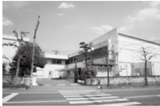
本年度で取り壊しとなる旧敷島庁舎