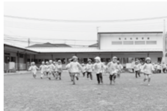
地域コミュニティの機能も担っている「竜王北保育園」

市長 赤坂地域の市街化区域に隣接し、一体的な日常生活圏を構成している一部の地区は、開発条例を制定すれば、一般住宅などを目的とした開発行為が可能となる。今後、赤坂地域を含め市街化調整区域のあり方を検討し、条例制定に向け取り組みを考えている。