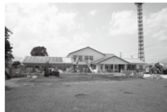
園舎が建て替えられた「竜王中央保育園」

また、国会において継続審議となっている合併特例債の期間延長の行方を注視し、延長後は主要事業の繰り延べなど中長期の財政見通しを策定した中で、計画的な事務事業の執行に努める考えである。