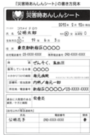
さまざまな呼び名で活用されているシートの一例

質問の「ヘルプカード」は、災害時に限らず、障がい者などが日常生活において不測の事態に陥ったときに、周囲の方々に緊急連絡をしてもらうことや、一時的な対応をってもらうことなどが主な活用と考えられるので、今後、先進事例を参考に検討する。