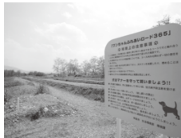
釜無川河川敷に新設された「ワンちゃんふれあいロード365」