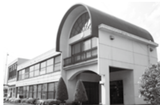
大規模改修が行われる竜王南部公民館