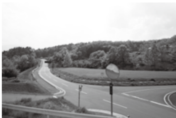
茅ヶ岳東部広域農道沿い梅の里ラインガルテン付近の様子

また、中山間地域総合整備事業での鳥獣害防護柵の設置や基幹農道の整備などで、効率的な農業経営が図られるものと考え、今後も地域の特徴を生かし集落と農業とのバランスを図りながら農業経営が展開できるような施策を検討する。