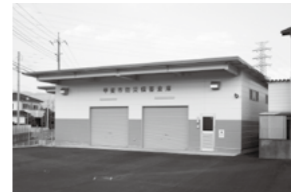
市役所東側に建設された甲斐市防災倉庫

市長 昨年3月の東日本大震災の発生により防災対策の強化が求められており、新たに地震ハザードマップの作成や地域防災計画の見直し、災害に備えた備蓄品の整備で地域防災力の向上を図る。また、生徒数の増加に対応した双葉中学校の改修や敷島中学校および竜王南部公園の夜間照明施設の改修、竜王東保育園の建て替え、太陽光エネルギー利用の奨励、境川の一般廃棄物最終処分場建設に係る負担、老朽化した可搬ポンプ車の買い替え、消防ポンプ小屋の建築などを予定している。