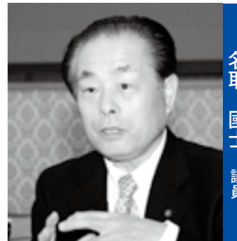
■公明党 名取 國士 議員

また、依然として碎石などの建築建材や堆肥、腐葉土などの農地への影響を心配する市民の声があることから、4月からは市民へ放射線量測定器の貸し出しを行い、市民自らが自己所有地などの測定を行い、「安心・安全な甲斐市」の確認と不安解消を図っていきたいと考えている。