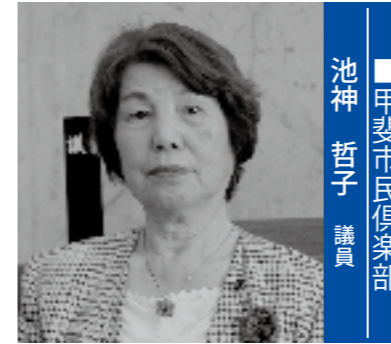
■甲斐市民倶楽部 池神 哲子 議員

池神 市長は、竜王駅周辺整備事業を引き継ぎ、まちおこし事業にもいろいろ着手してきた。また、創甲斐教育の推進や病児・病後児保育などの実施、市民対話集会などによる市政や地域などの課題について、直接対話を通して市民ニーズを探る手だてを図るようになった。これらの施策の検証と今後の発展への展望について、市長の考えを聞く。