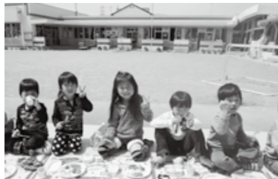
本年度末に移転予定の「竜王東保育園」

市長 先の東日本大震災に伴い耐震補強などの施工が急務となった現状を踏まえ、施設整備計画および財政計画の見直しを図り、さらなる経営健全化に向け積極的に取り組む考えである。