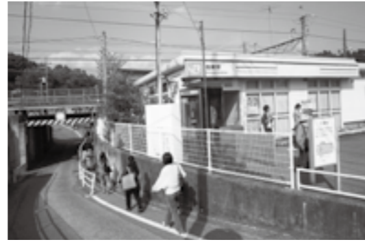
駅前広場などの周辺整備が進められるJR塩崎駅