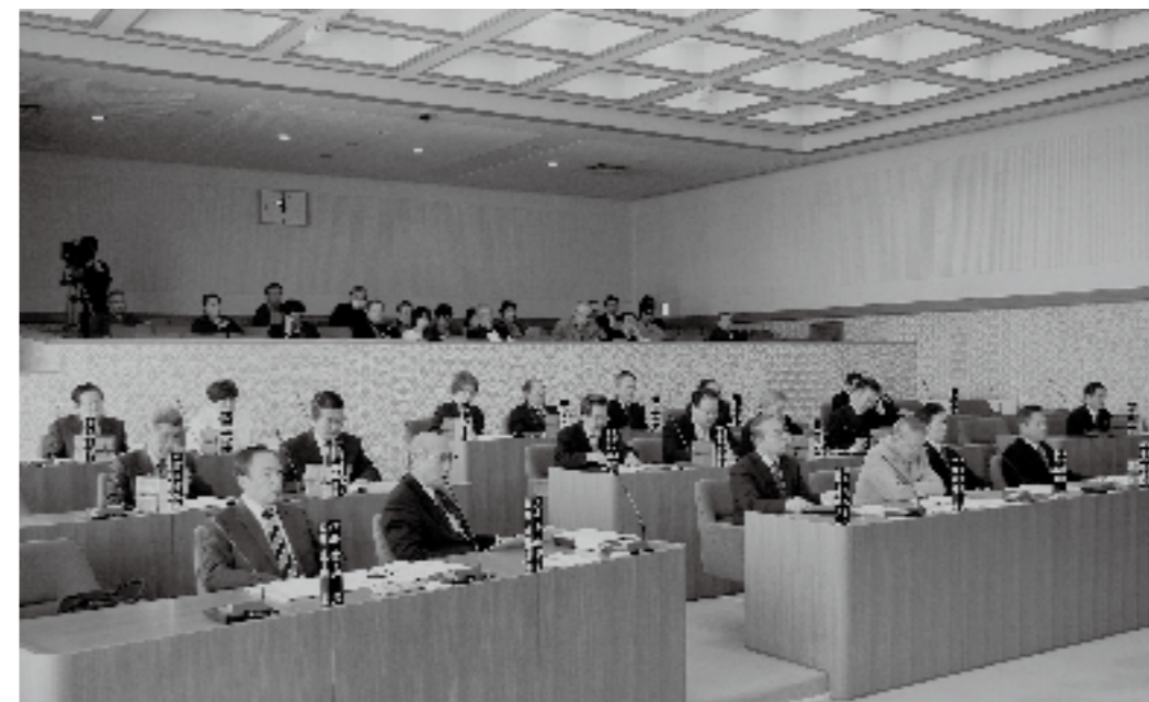
第1回定例会の様子