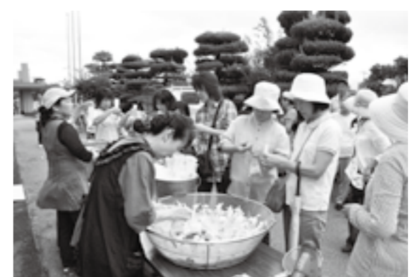
総合防災訓練での炊き出し訓練の様子(竜王南小学校)

教育長 この事業は、ボランティア活動の推進支援と学校防災アドバイザーの活用方法などを一体的に実施するものである。その内容は、児童・生徒が自ら命を守り抜くための判断力を育成する教育手法の普及促進や外部有識者のチェック・助言による学校防災体制の再構築などである。今後、国から具体的な事業内容が提示された時点で、速やかに対応する考えである。