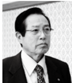
樋泉 明広 議員