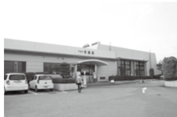
市民温泉「百楽泉」(指定管理者：山梨交通㈱)