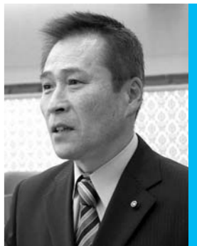
小澤 重則 議員

市長 複線型人事制度は、行政の多様化、高度化に対応するため、総合職だけでなく、スペシャリストを配置して行政運営を行う制度である。本市でも、甲斐市人材育成方針の中で研究すべき制度として位置づけを行っている。現在、保健師や保育士、栄養士、司書、土木技師などが専門職として業務に従事しているが、異動の際に職員から取りまとめる自己申告書の活用やヒアリングによって、各職員の希望も把握しながら、人事管理と本人の意欲を具現化することに努め、職員配置を行う考えである。今後は、ライン管理職ポストとあわせ、専門的能力を持った人材の育成、活用を研究する考えである。