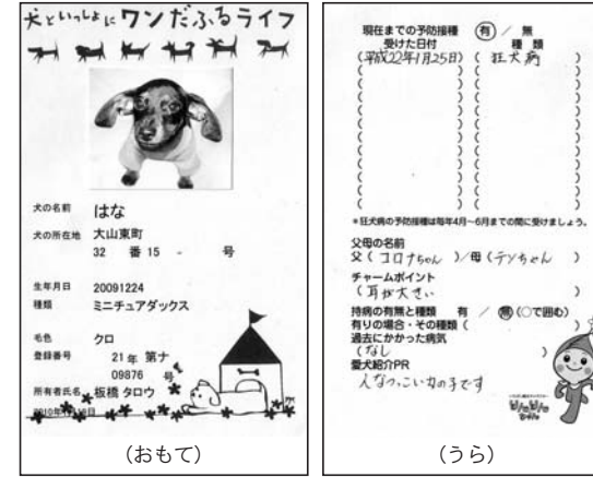
東京都板橋区の「犬の住民票」

市長 ▶ 板橋区では、犬の登録率と予防接種の増加を図る試みとして、平成22年1月から犬の住民票を発行する事業を始めた。はがき大の用紙に犬の名前や住所、生年月日、毛色、登録番号などを記載したものを発行し、飼い主がこれに愛犬の写真を張り予防接種の記録や愛犬のコメントなどを書き込めるようになっている。本市では、登録犬のさまざまな情報をコンピューター処理しているので、犬の住民票発行という考えはない。