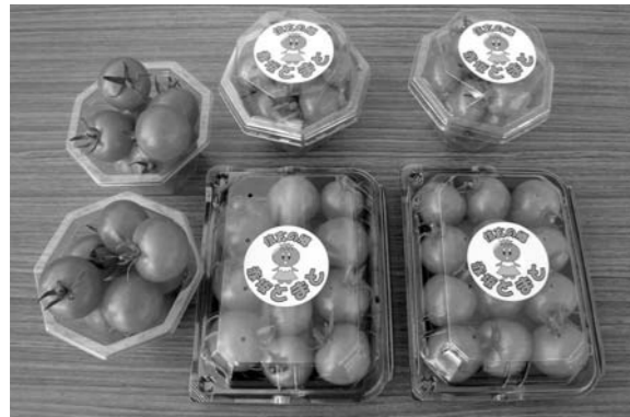
ブランド化を目指す3種類の「赤坂とまと」

新聞やテレビでも取り上げられ、広くPRすることができた。また、赤坂地区のトマトの栽培も事業が順調に進捗し「赤坂とまと」のブランド化を目指している。今後は、これ以外の市内の資源の有効活用や特色を生かした事業展開を図り、県内外に向けてイメージアップを図る考えである。