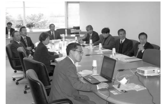
「新潟市」視察の様子

新潟市の「プリペイド方式による学校給食」は、あらかじめランチカードに必要な金額だけをポイントとして購入して、そこから給食を予約するというものです。生徒は、今まで通り、自宅からのお弁当か給食かどちらかを選ぶことができ、しかも給食は、メニューも選ぶことができます。このように画期的なものです。このカードの利点は、給食費の滞納がないこと。それは、事前購入だから滞納しないし、業者が直接生徒から徴収するので先生の手を煩わすことがない点にあります。また、このカードでは、ポイントを購入しないと食べ