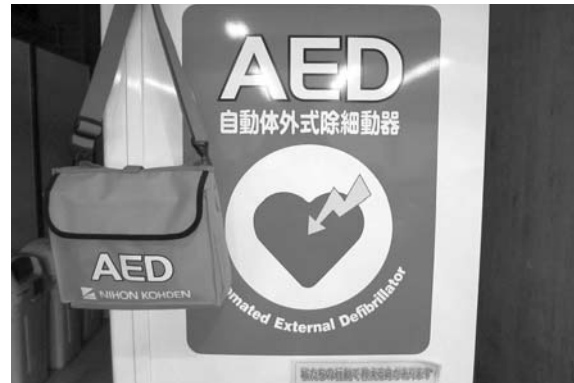
自動販売機に設置されたAED（竜王庁舎1階）