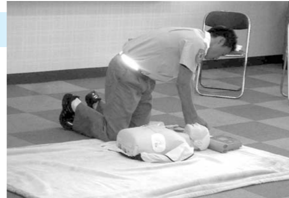
市職員AED講習会(講師:西消防署救急救命士)