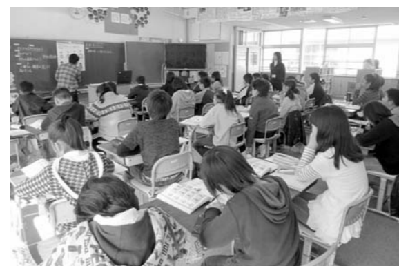
竜王東小学校の授業の様子

樋泉 ▶ 現在、県内の小学校1・2年生には30人学級、中学校1年生には35人学級が導入され、いじめや不登校の減少、教師の目の行き届いた教育の成果を聞いている。県では、来年度から他学年にも拡大を検討しており、