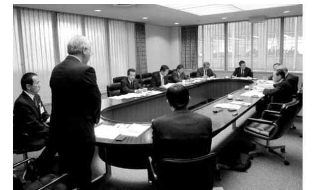
「松戸市議会」視察の様子

ト配信、議案審議の内容などを市民に報告する議会報告会の開催、議会基本条例の制定などの改革を行ってきました。 また、議会基本条例の成案作成にあたっては、議員全員の同意が得られる内容であることや、市民の意見募集、公聴会の開催など市民の意見を聞き、条例に反映させるなどの配慮をして進めたとのことでありました。 2日目 松戸市は、都心から20km、人口約48万人、「すぐやる課」の設置で有名な市です。 同市は、「議会報告会」を除き鶴ヶ島市と同様な改革を行ってきたとのことですが、特に他市と違った取り組みとして、請願・陳情の審査において委員間の意見交換を深め活性化するために、フリートーキング制を設けていることです。 また、常任委員会自らが市政に関する課題を選び出して、そのテーマに対し閉会中も継続的に調査を続け、意見集約ができたものは、議会の意思として議決し、執行部、市民に議会の意思を発信していくという先進的な取り組みをしているとのことでありました。