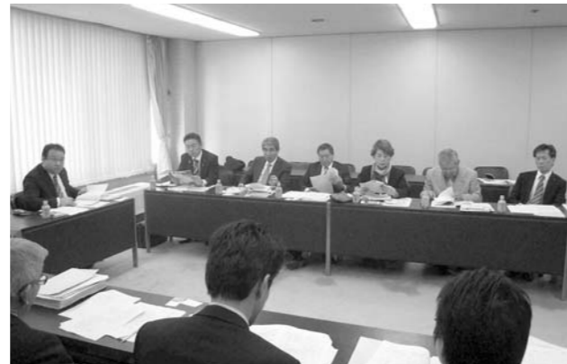
「茅ヶ崎市議会」視察の様子