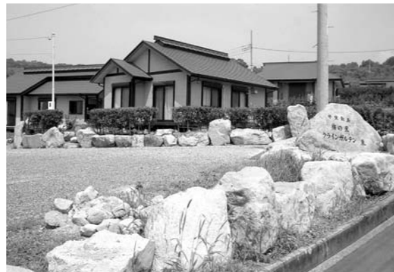
クラインガルテン「ラウベ」(滞在型施設)