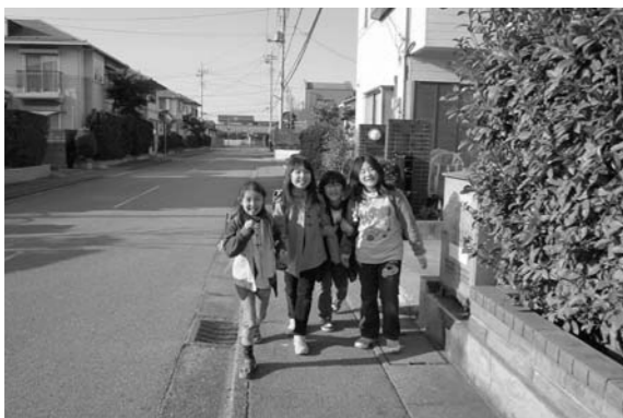
まずは整備を優先したい歩道設置

市長▶小中学生の自転車事故の多くは、左右安全の不確認や一時停止違反、信号無視などが原因と言われている。市としては、警察署および交通指導員等の協力をいただき小学1・2年生は、歩行・横断指導、3・4年生には自転車安全教室などを行い、交通安全指導を実施している。また、生活道路等への自転車専用レーンなどの整備については、まずは地域から要望の多い歩道の整備を優先する考えである。今後も、それぞれの過程に応じた交通安全指導を行い、交通事故の防止に取り組んでいく。