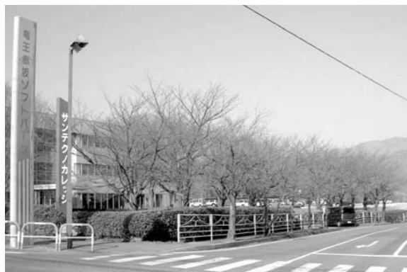
竜王赤坂ソフトパークの一角「サンテクノカレッジ」

市長 ▶ 竜王赤坂ソフトパークは、学術研究機関等の誘致を進めた地域であり、情報通信関連の専門学校のほかコンピュータの周辺機器開発、ソフトウェア開発、宝飾デザイン、測量コンサルティングなど現在11事業所が入居している。市としては、これまでに以上に相互に連携を図り、情報交換などを通じて企業の特性を生かした「まちづくり」や地域発展に寄与できる可能性などを研究する考えである。