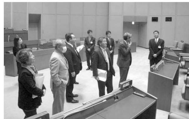
「小田原市議会」視察の様子

また、市議会だよりを集客力のある店舗や金融機関など多くの公共施設に設置するなど、開かれた議会運営に力を入れるほか、議会だよりに開けられている綴じ穴を廃止するなど経費の削減に取り組んでいました。経費を掛けずともできる広報活動に前向きに向き合っている小田原市議会には、見習うことが大いにありました。