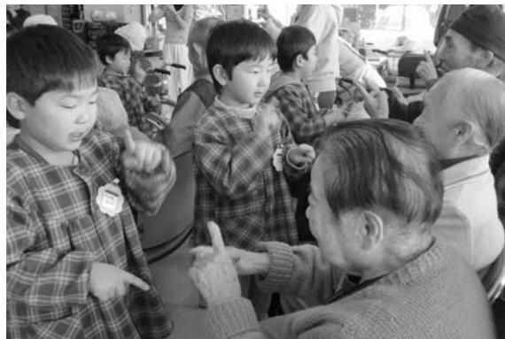
双葉西保育園の高齢者交流事業

栄養、運動、休養の調和を図り健康づくりを行うことがその目的のひとつで、単に身体健康づくりばかりでなく、日常の行動様式と生活態度を変容し、自分自身に適合した最高のライフスタイルを築くことを究極の目的とし、より充実した幸福な人生を得てゆこうというものです。