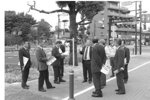
東京都都市計画道路「調布保谷線」現地視察の様子

1日目 午前中は、東京都の北多摩南部建設事務所が進めている都市計画道路事業を視察しました。多摩地域を南北に結ぶ都市計画道路の調布保谷線の経緯、経過等を現地において担当者から懇切丁寧に説明を受けました。特に印象に残ったのは、整備にあたっては「住民協議会」を立ち上げる中で、住民の皆さまのご意見やご要望を何回も伺いながら進めた点です。また、この地域は武蔵野の面影を残す非常に環境の好い所なので、完成後も維持管理において住民ボランティア