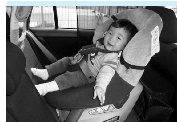
6歳未満のお子さんには、チャイルドシートの着用を

市長 全額助成は、国の決定により遅滞なく実施できるよう対応するが、年齢拡大は、国や県の基準に準じ対応する考えである。