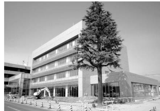
2月末完成予定の竜王庁舎新館(3・4階が竜王北部公民館)

旧三町が合併し使用料にばらつきがあったため、平成19年度に市内公民館の使用料を統一した。そのときにホールなどの特別室を除く会議室は、部屋の面積が55㎡以上の場合1,000円、55㎡未満の場合は500円と決めている。