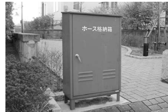
消火栓付近にあるホース格納庫