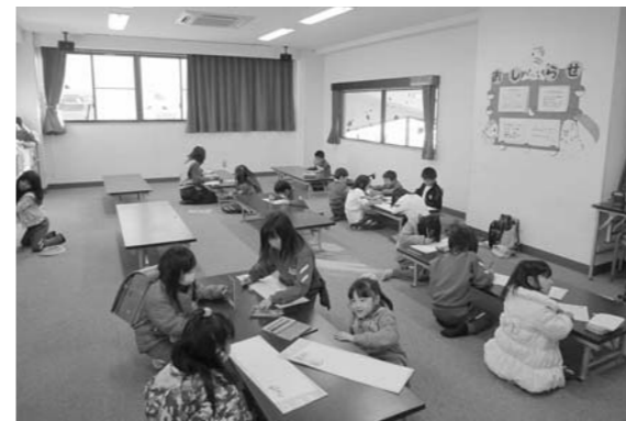
学童保育の様子（敷島ふれあい中央児童館）

市長 ▶ 小学4年生からは、学童保育から自立するケースが定着しているため、今後も現状どおりの事業を継続する考えである。