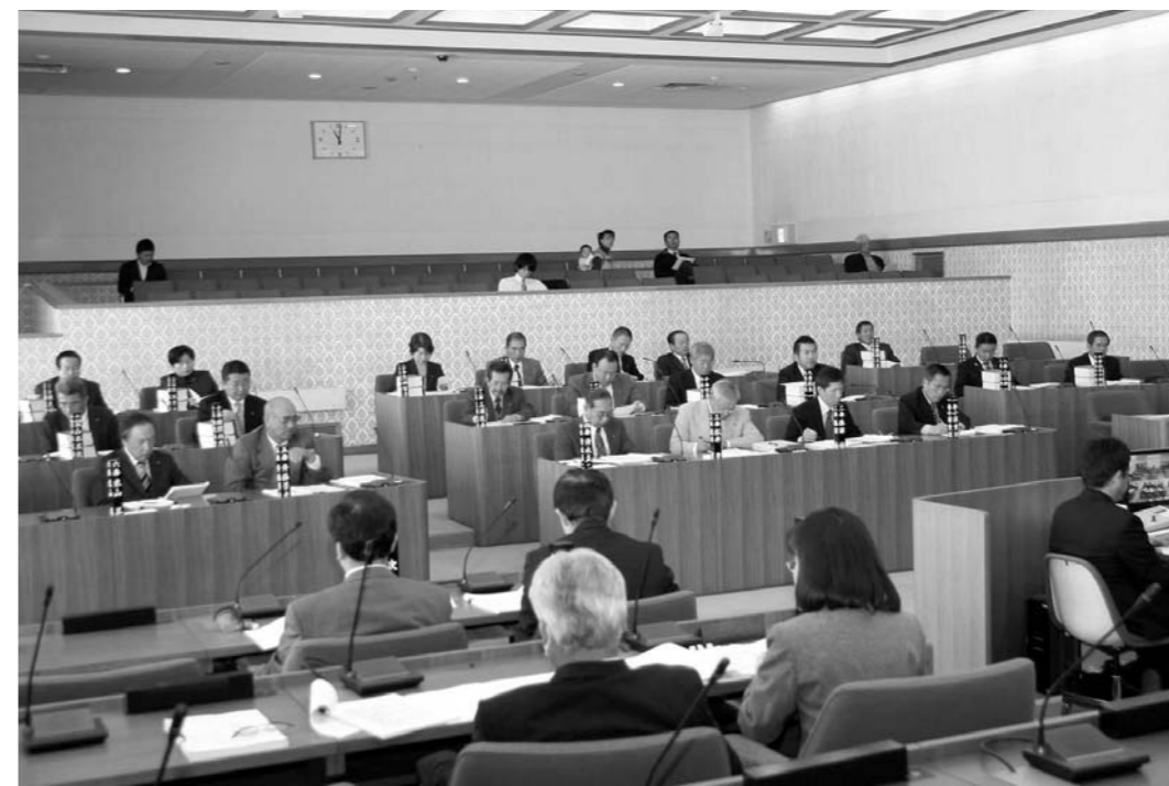
第4回定例会の様子