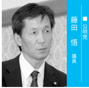
■公明党 藤田 悟 議員

藤田 ▶平成21年から創甲斐教育の取り組みがはじまり、赤ちゃんから高齢者までのすべての市民が心豊かな生活が実感できるまちづくりを推進している。近年、電子書籍の普及や出版社の登場、そして話題のiPadなどの普及によって、こうした電子書籍のニーズは飛躍的に高まると予想される。既に国内でWeb図書館(インターネット)を使用して電子図書(インターネット)を使用して電子図書(インターネット)を返却可能な図書館サービス)を立ち上げている自治体があり、さまざまなメリットもあるが、甲斐市でのこのWeb図書館の導入について所見を聞く。