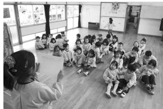
園児自作の紙芝居の発表（竜王北保育園）

市長 ▶ 国は、平成42年の交通量推計値で新山梨環状道路北部区間は、2万1千台から2万8千台と見込んでいる。これにより、市内の主要幹線道路の渋滞緩和につながるものと想定している。