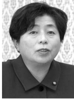
■公明党 保坂 芳子 議員

市長 現在の設置状況は、市役所庁舎や小中学校など41か所と警察署、消防署や民間事業所などで32か所に設置されている。今後の整備計画は、本年度、保育園・幼稚園・児童館の計20施設へ設置する予定で、今定例会で補正予算を計上している。