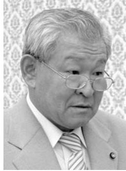
松井 豊 議員 日本共産党甲斐市議員