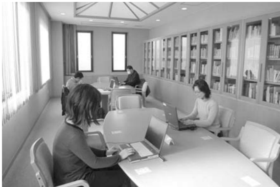
個人PCでインターネット接続が可能となった竜王図書館

教育長 ▶図書館事業は、今年度から竜王図書館で無線LANによるインターネット検索サービスを開始し、利用者の利便性強化を図っている。質問のWeb図書館の導入は、今後、県内外の図書館の動向などを注視し検討するが、現段階では導入の計画はない。