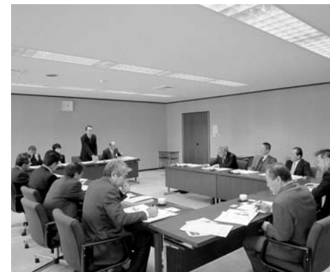
「鶴ヶ島市議会」視察の様子

円滑な議会運営を行うため、議会運営委員会が設置されています。今回は、議会報告会を開催し、市民に広く議会の活動をPRしている鶴ヶ島市議会と各常任委員会が、執行部に対し政策提言を行っている松戸市議会の視察研修を行いました。 1日目 鶴ヶ島市は、埼玉県のほぼ中央に位置し、人口約7万人、都心から45kmと恵まれた条件にあることから近年人口が急増している市です。 同市議会では、「もつと身近な議会へ」「もつと確かな議会へ」をキヤッチフレーズに議会改革を進めてきたとのことであり、これまでに議員定数の削減、一般質問の一问一答方式の導入、本会議のインターネット