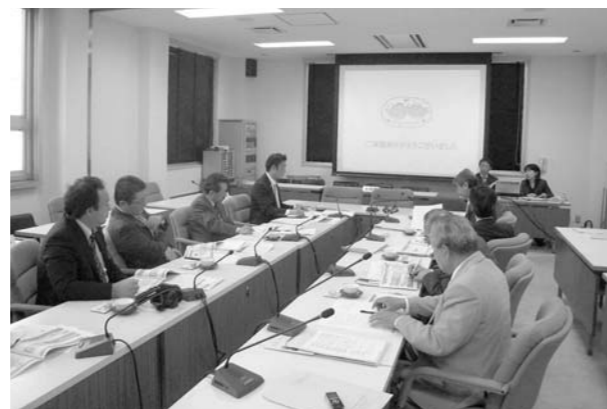
「藤沢市」視察の様子