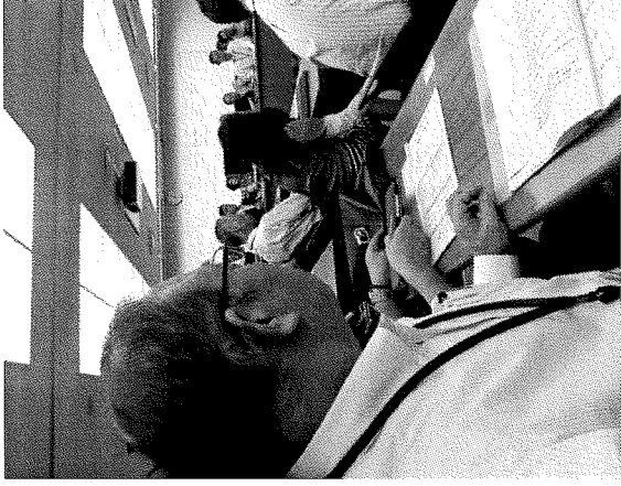
研修1日目 受講状況