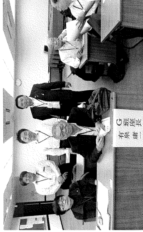
研修3日目 政策立案発表状況