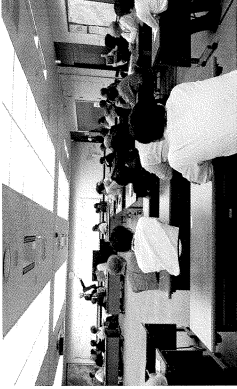
研修3日目 政策立案発表状況