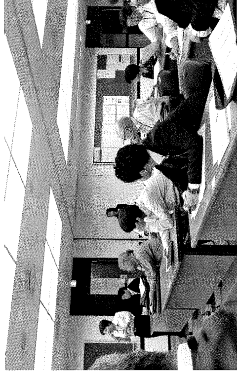
研修3日目 政策立案発表状況