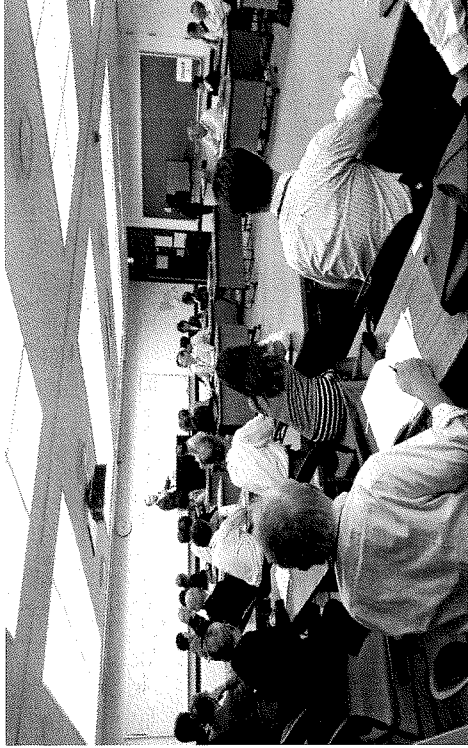
研修1日目 受講状況