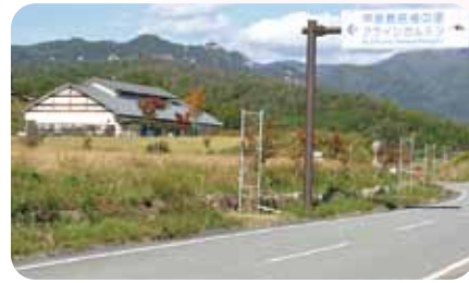
クラインガルデン

合併後10年の歳月が経過した中で、合併時に掲げた目標に対し、達成したと評価できる内容や、道半ばと言える内容について施策全般から、代表質問をしました。