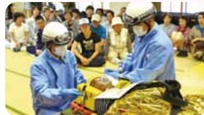
清川地区ふれあい館での総合防災訓練

子ども・子育て支援法改正に伴い6年生まで拡大される学童保育への取り組み について 災害時における要援護者への支援の取り組みについて