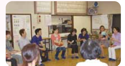
玉川東での子育て支援学習会

平成26年度定例会に於いて以上の質問をしました。27年度も市民の皆様のご意見を市政へつなげてまいります。