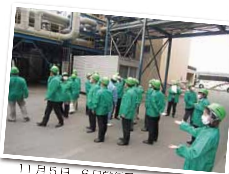
11月5日、6日常任委員会合同研修で茨城県にある神之池バイオマス発電所の見学をしました。