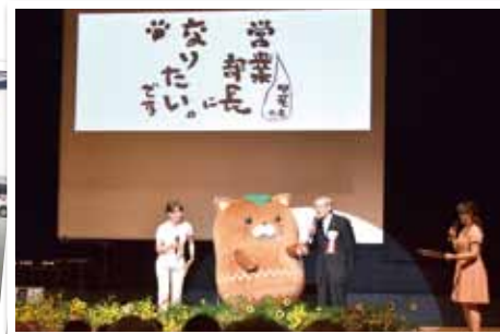
甲斐市は昨年の9月で合併10周年をむかえ、マスコットキャラクターの「やはたいぬくん」がデビューしました。