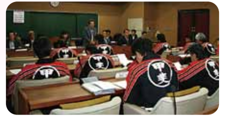
消防団の皆様は日夜私達の安心安全なくらしを守って下さっています。