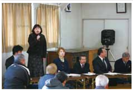
今年に入り下今井地区において「議会と語ろう」という集会が開催されました。いろいろなご意見を地区の皆様からいただきました。寒いなかありがとうございました。