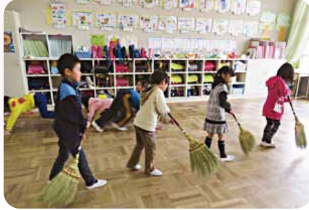
「甲斐市で育ち、甲斐市を育てる人づくり」を基本理念に「創甲斐教育推進大綱」が策定され、昨年見直しが行われました。

また、敷島中学校にプールを建設すること、市の文化遺産や民俗資料を保管・展示する為の「歴史民俗資料館」の建設について、要望しました。